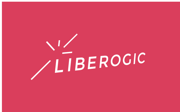
【 Negative Image 】